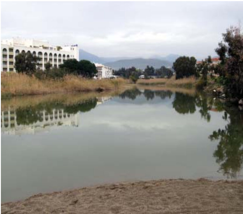
Desembocadura del río Verde de Marbella (parada 2)