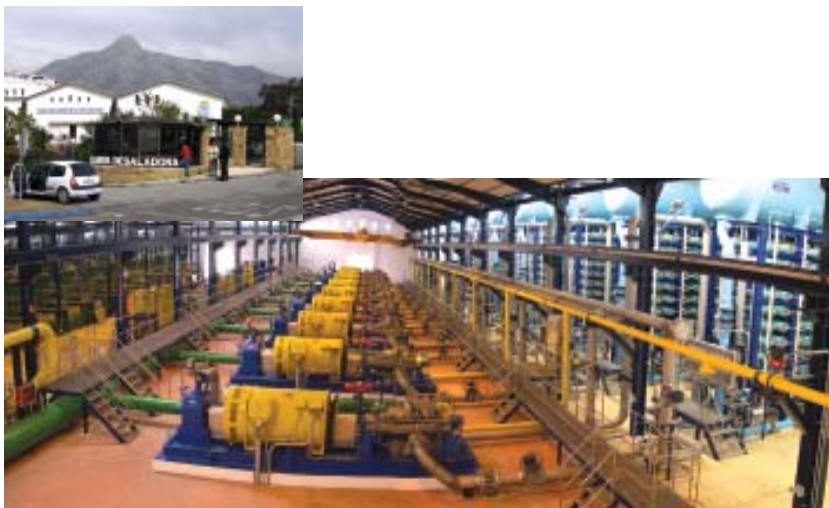
Vista general del interior de la planta desaladora

Para acceder a la planta desaladora es necesario tomar el desvío de la A-7 (CN-340) indicado como "Istán y Nagüeles". La planta se encuentra en la margen izquierda del río Verde, muy cerca del citado cruce. Para visitarla se deberá contactar previamente con la empresa responsable (ACOSOL, S.A).