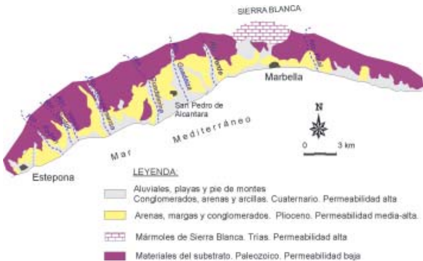
Figura 12. Esquema hidrogeológico de los acuíferos de Marbella - Estepona (DIPUTACIÓN DE MÁLAGA, 1988)

La facies hidroquímica predominante es bicarbonatada cálcica o magnésica, en relación directa con la alimentación dominante a través de la infiltración de aguas superficiales procedentes de macizos carbonatados situados al norte. En algunos puntos de la desembocadura de los ríos Verde, Guadaiza y Guadalmina se detectan aguas cloruradas sódicas, en concordancia con los procesos de salinización comentados anteriormente.