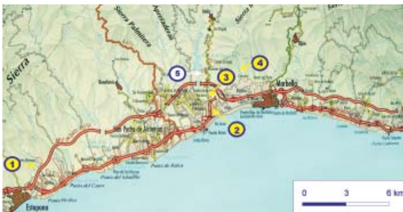
Figura 11. Mapa de situación del itinerario propuesto. La foto superior muestra la llanura litoral acuifera que se extiende al suroeste de Marbella, en dirección a Estepona