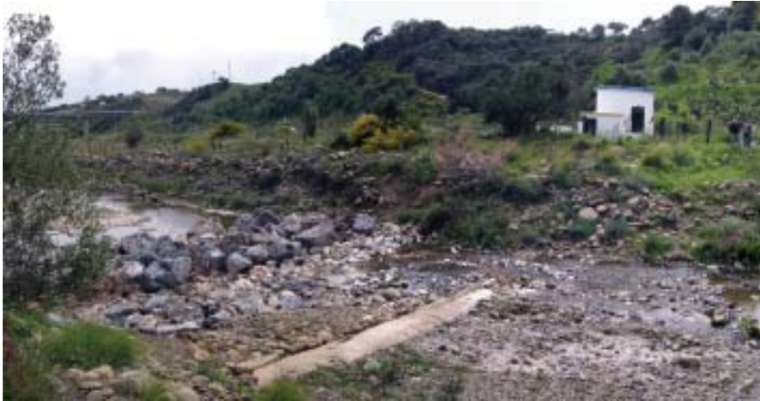
Captación de abastecimiento a Estepona (pozo Padrán Alto). En el cauce del río puede observarse parte de la galería transversal de captación y la escollera de retención de aguas (parada 1)