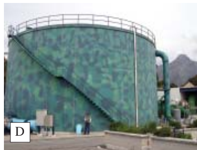
Figura 14. Proceso de desalación seguido en la planta de Marbella (parada 3), (esquema cedido por ACOSOL, S.A.). (A) Sala de bombeo de agua de mar. (4 bombas con capacidad para impulsar 500 l/s cada una). (B) Filtros de arena. (C) Bastidores de membranas y (D) Tanque de agua desalada, lista para su envío a la ETAP

desalación, pero los caudales bombeados fueron insuficientes, posiblemente por un mal diseño y/o ejecución de la citada batería de sondeos.