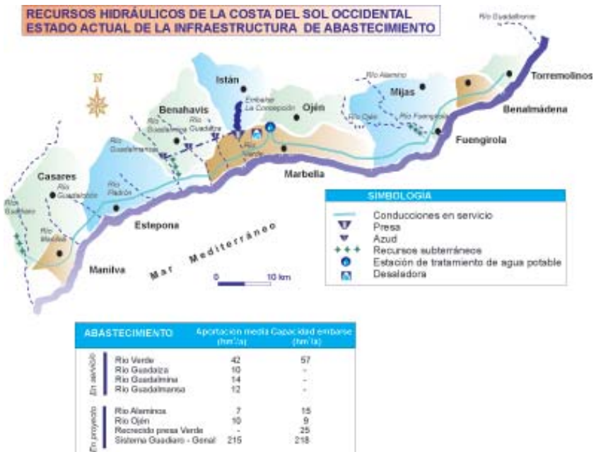
Figura.16. En la parte superior, embalse de La Concepción (parada 5) y en la inferior, estado actual de la infraestructura de abastecimiento de la Costa del Sol Occidental